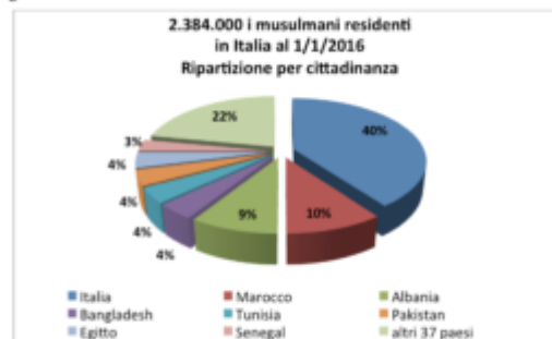
Figura 2 - Stima dei musulmani residenti in Italia